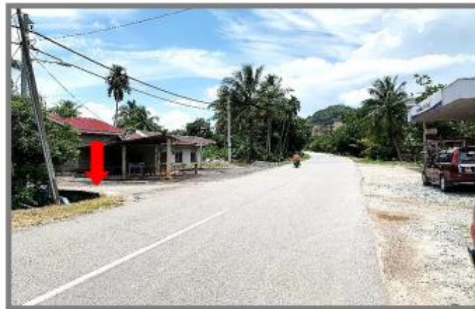
Jalan Bukit Jambul (Jalan Keluar / Masuk Ke Tapak)