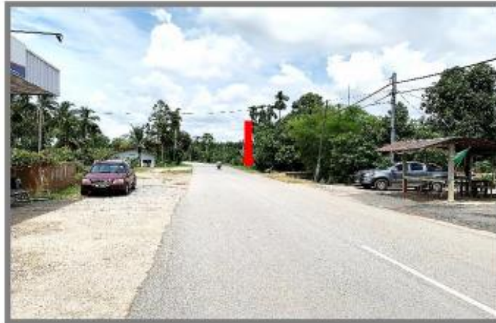
Jalan utama [ Jalan Bukit Jambul ] (Dari Bandar Pendang)

Gambarajah 1 : Keadaan tapak pada masa kini