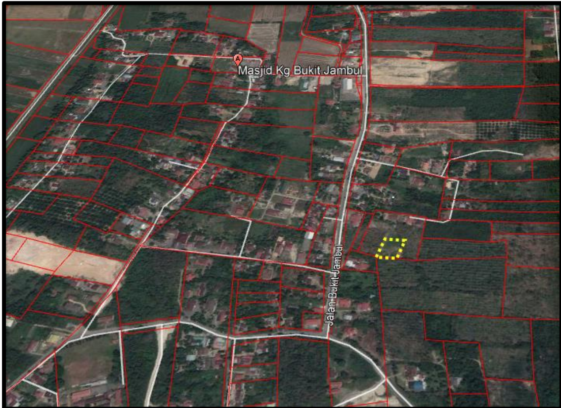
Rajah 1 : Foto Udara Kedudukan Tapak Cadangan

Analisa keadaan semasa di buat dengan mengambil kira beberapa aspek berhubung perihal tapak cadangan, analisis fizikal dan potensi atau halangannya bagi menyokong Permohonan Kebenaran Merancang Bagi Mendirikan 1 Unit Rumah Sesebuah 1 Tingkat Di Atas Lot 123, Mukim Air Puteh, Daerah Pendang, Kedah Darul Aman.