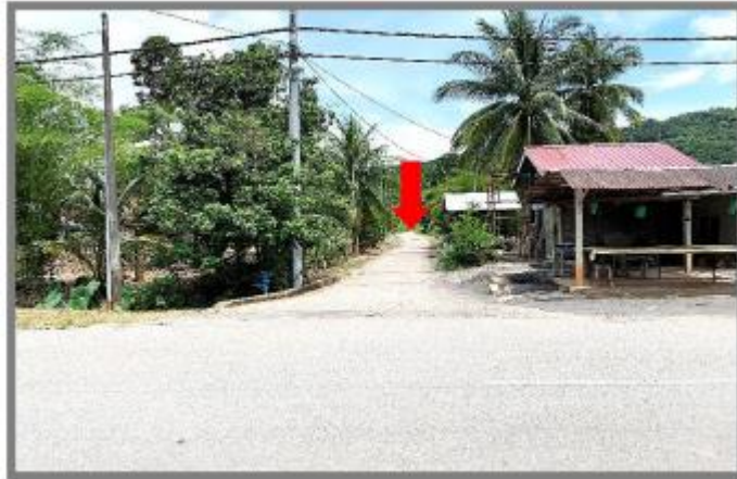
Jalan Keluar / Masuk Ke Tapak (Dari Jalan Utama)