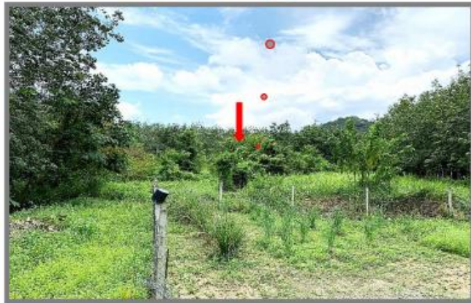
Tapak Cadangan (Tampak Hadapan)