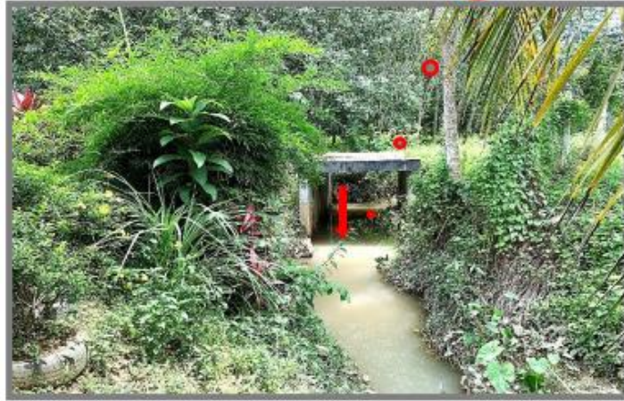
Rajah 3 : Anak Sungai Sediada