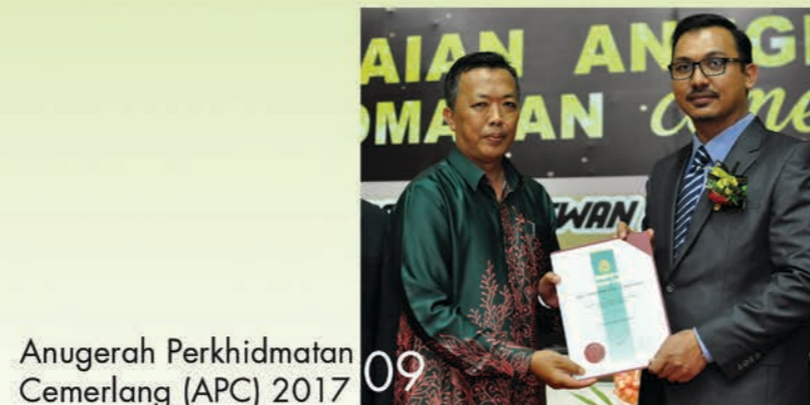
Anugerah Perkhidmatan Cemerlang (APC) 2017