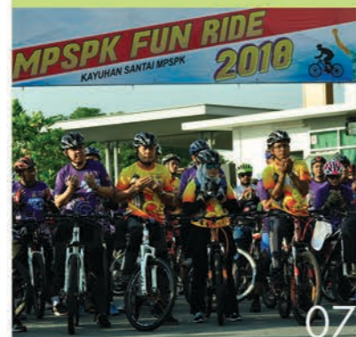
07 MPSPK Fun Ride 2018