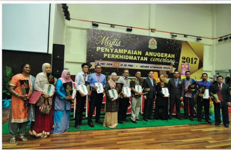
Majlis Anugerah Perkhidmatan Cemerlang 2017 15 Mei 2018 Dewan Kenangan MPSPK

Yang Di Pertua, memberi ucapan padat yang menyentuh perihal sumbangan jasa dan bakti yang ikhlas kepada semua lapisan masyarakat tempatan. Seiring dengan lajunya modenisasi, warga kerja harus cepat beradaptasi dengan kemajuan teknologi agar tidak ketinggalan.