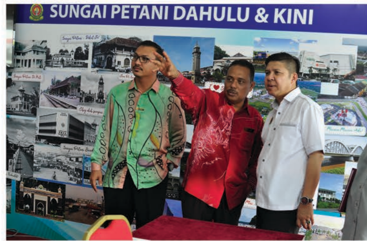
Karnival Sehati@RTM 15-17 Mac 2018 Dataran Amanjaya Mall, Sungai Petani

Karnival Sehati @RTM anjuran stesen TV Radio Televisyen Malaysia telah berjalan dengan jayanya selama dua hari. Menampilkan pelbagai variasi acara hiburan, riadah serta pendedah pengetahuan dunia penyiaran kepada masyarakat.