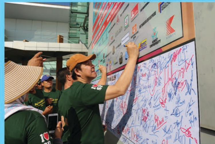
My Beautiful SP 03/02/2018 Sekitar Pusat Bandar Sg. Petani

Seramai 1,500 peserta daripada pelbagai agensi kerajaan dan swasta termasuk penuntut-penuntut kolej komuniti menyertai acara gotong-royong "My Beautiful SP".