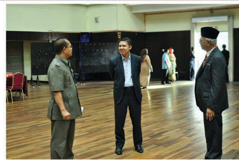
Pendaftaran & pengundian Bazar Ramadan/Aidilfitri 19 - 21 Mac 2018 Dewan Kenangan MPSPK

Sempena menyambut bulan Ramadan pada tahun ini, MPSPK telah menyediakan tapak-tapak jualan Ramadan & Aidilfitri di Kompleks Seri Temin, Jalan Padang, Taman Sejati Indah, Wisma Ria, Taman Ria Jaya, Taman Sejati Indah, Bandar Laguna Merbok, Bukit Selambau, Pekan Merbok dan Tanjung Dawai.