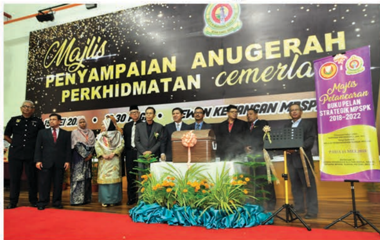
Buku Pelan Strategik MPSPK 15/5/2018 Dewan Kenangan, Menara MPSPK

Seiring dengan majlis Anugerah Khidmat Cemerlang, MPSPK turut membuat pelancaran Buku Pelan Strategik MPSPK 2018-2022.