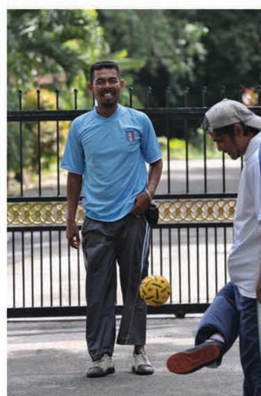
Karnival Sepak Raga Tuju MPSPK 25 Februari 2018 Taman Jubli Perak, Sungai Petani

Acara ini turut dimeriahkan dengan pemberian beberapa kotak bola takraw kepada guru-guru yang mewakili beberapa sekolah rendah dan menengah di sekitar bandar Sungai Petani.