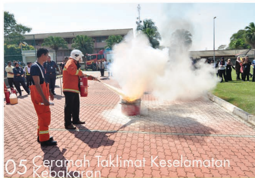
05 Ceramah Taklimat Keselamatan Kebakaran