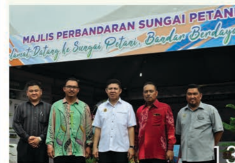
13 Karnival Sehati @ RTM