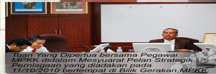
Tuan Yang Dipertua bersama Pegawai MPKK didalam Mesyuarat Pelan Strategik Perniagaan yang diadakan pada 11/10/2010 bertempat di Bilik Gerakan, MPKK.