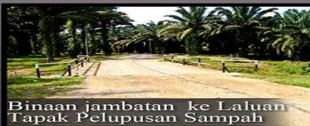
Binaan jambatan ke Laluan Tapak Pelupusan Sampah