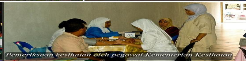
Pemeriksaan kesihatan oleh pegawai Kementerian Kesihatan.