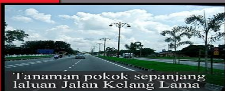
Tanaman pokok sepanjang laluan Jalan Kelang Lama