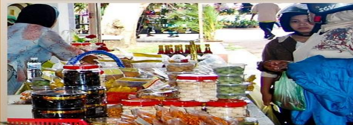
Pelbagai jenis kuih tradisional turut dipasarkan sempena Program Keusahawan pada 16/10 - 3/11/2010 di Dataran Usahawan