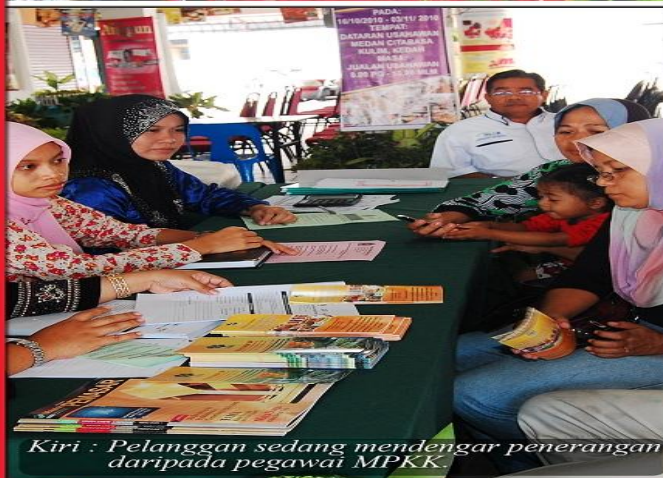
Kiri : Pelanggan sedang mendengar penerangan daripada pegawai MPKK.

Pameran orkid sempena 'Kulim Flora Fest 2010'