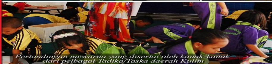
Pertandingan mewarna yang disertai oleh kanak-kanak dari pelbagai Tadika/Taska daerah Kulim.