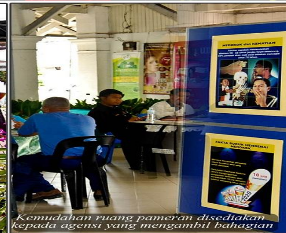
Kemudahan ruang pameran disediakan kepada agensi yang mengambil bahagian.