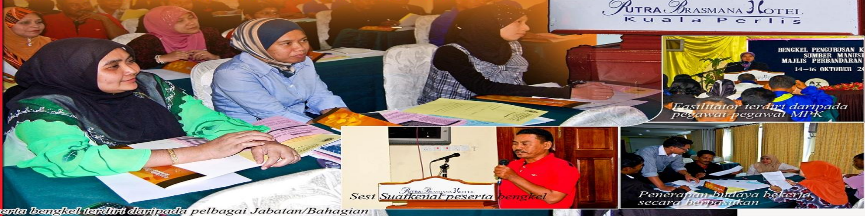
Peserta bengkel terdiri daripada pelbagai Jabatan/Bahagian

Dengan adanya, peningkatan budaya kerja tersebut pelbagai program turut didedahkan ke pelbagai peringkat anggota. Majlis Perbandaran Kulim telah mengadakan pelbagai program kearah peningkatan pembangunan anggota. Tuan Yang Dipertua telah mengendalikan sendiri bengkel-bengkel yang telah diadakan dan turut dibantu oleh beberapa Ketua Bahagian tertentu.