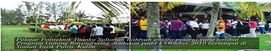
Pelajar Politeknik Tuanku Sultanah Bahiyah antara peserta yang terlibat Program Gotong Royong yang diadakan pada 1 Oktober 2010 bertempat di Taman Tasik Putra, Kulim

MPKK akan sentiasa meningkatkan pemeliharaan alam sekitar dan mengekalkan khazanah semulajadi kepada generasi akan datang.