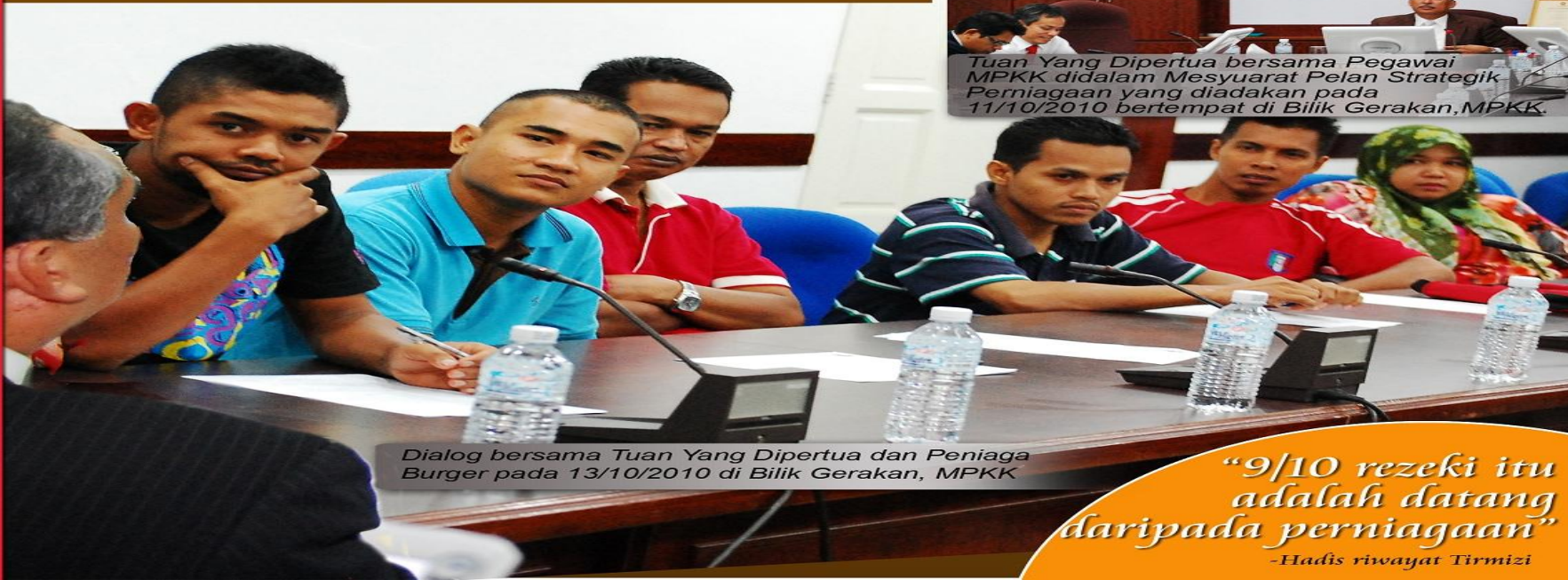
Dialog bersama Tuan Yang Dipertua dan Peniaga Burger pada 13/10/2010 di Bilik Gerakan, MPKK

"9/10 rezeki itu adalah datang daripada perniagaan"