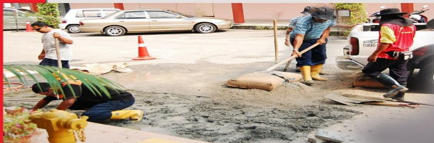
KERJA-KERJA PEMBINAAN DILAKUKAN SENDIRI OLEH ANGGOTA MPKK

"When you stop learning, you stop growing"