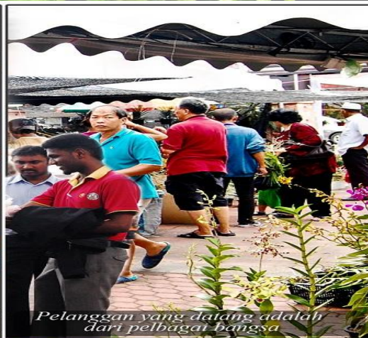
Pelanggan yang datang adalah dari pelbagai bangsa.