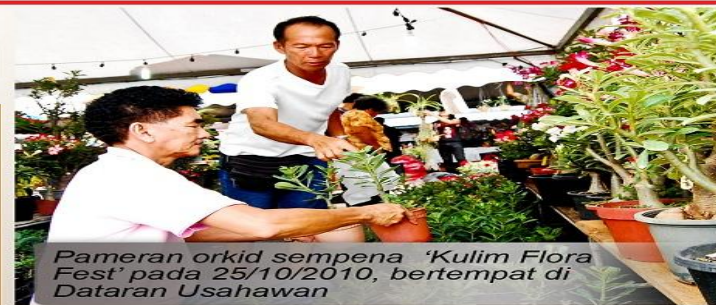
Pameran orkid sempena 'Kulim Flora Fest' pada 25/10/2010, bertempat di Dataran Usahawan

Majlis Perbandaran Kulim berharap dapat memberi peluang kepada peniaga kecil yang baru memulakan perniagaan dan diharap dapat mengurangkan jenayah dan aktiviti sosial yang tidak bermoral.