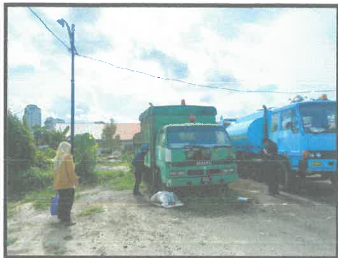
LORI RIGID – KARGO AM (KAG 1314)