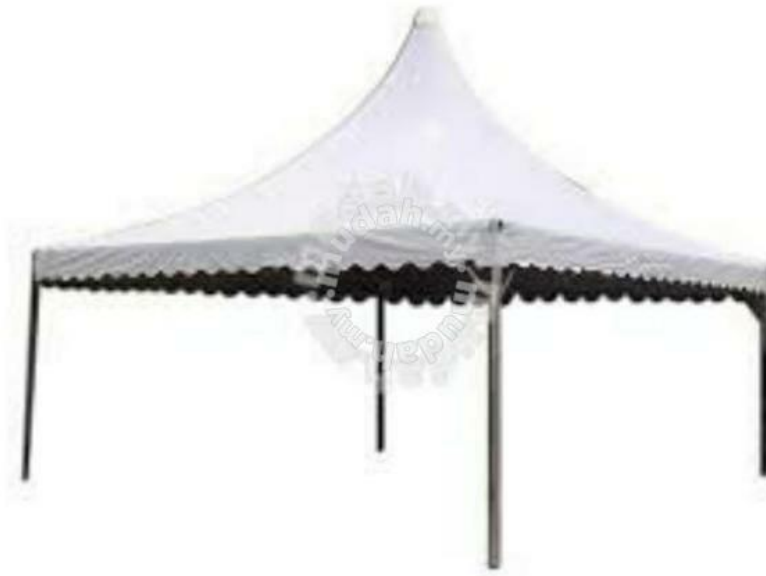
Khemah Arabic 20'x20'