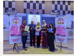
Anugerah Ibu Inspirasi Sempena Sambutan Hari Ibu Peringkat Daerah Yan