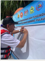
Restorasi Karang @ Pulau Songsong