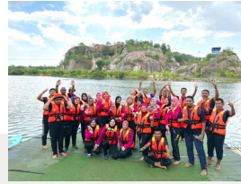
Penguuhan Pasukan & Integriti Kakitangan