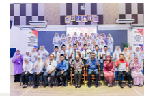
Program Motivasi Kecemerlangan Pelajar SPM Peringkat Daerah Yan