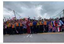
Konvoi Jalur Gemilang