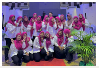
Perasmian Program Publititi Dan Penyertaan Awam Rancangan Tempatan Daerah Yan, Kedah 2035 (Penggantian)