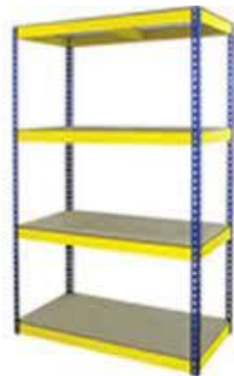
2' x 6'L x 6'H (4 Level) Rack – HDF Board