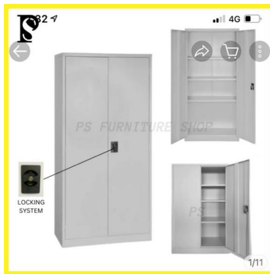
Full Height Cabinet (Metal)