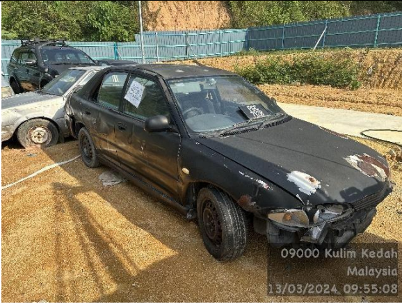
Proton Wira 1.5