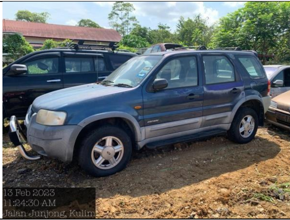
Ford Escape 2.0L(A)