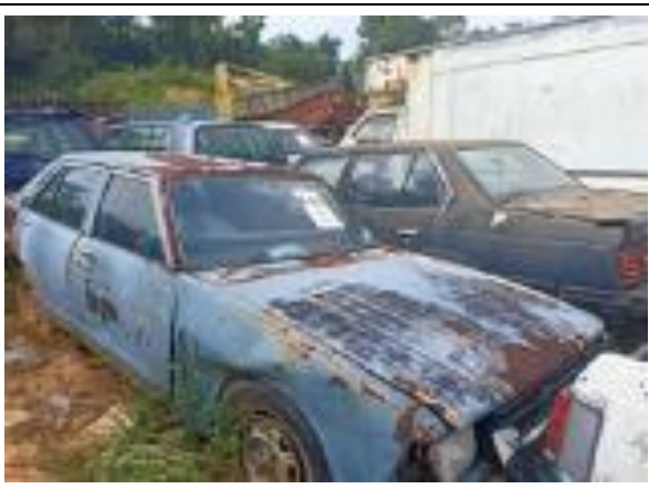
Nissan Datsun 120Y MPKK.JPK(S):599/24/04 (62)