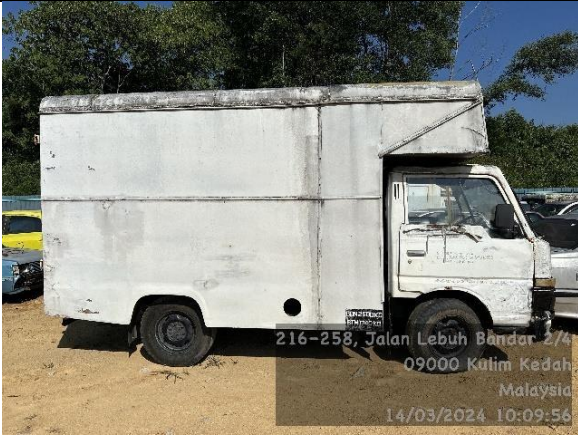
Nissan Cabstar AGF22LFAU