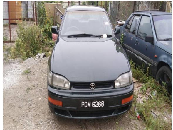
Toyota Camry 2.2GX