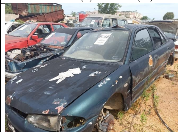
Proton Wira 1.5 GL (A)