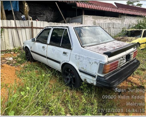
Nissan Sunny 130Y GL (M)