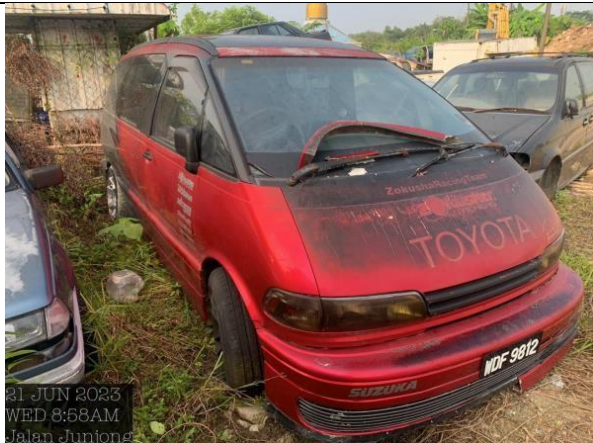
Toyota Estima E-TCR21W