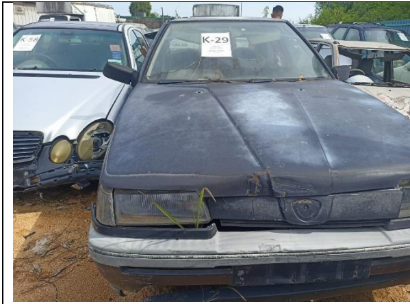
Proton Saga Iswara