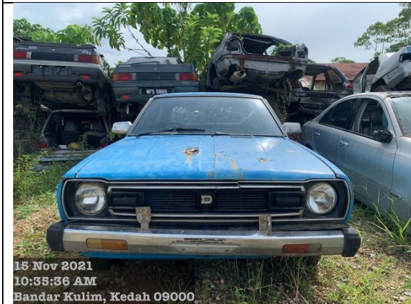
Nissan Datsun 120 Y - MPKK.JPK(S):599/24/04 (61)