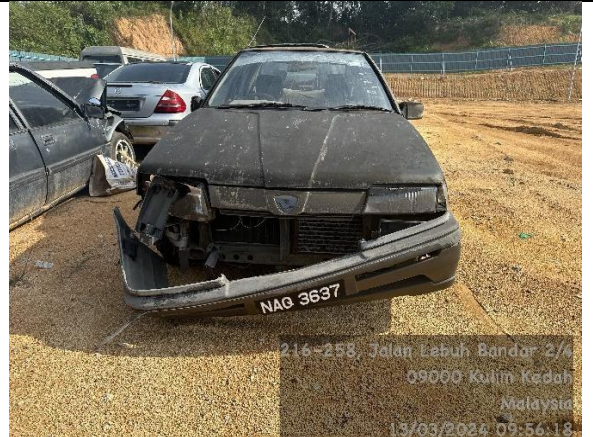
Proton Saga Iswara 1.3S