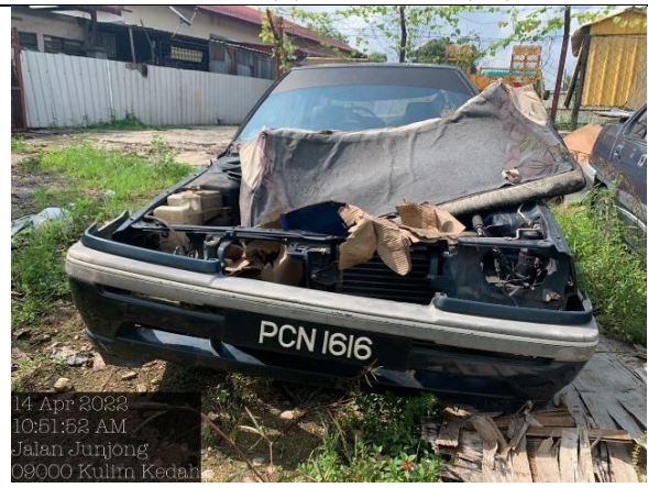
Proton Saga 1.3S