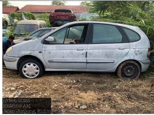
Renault Scenic RXES Auto 1.6