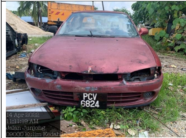
Proton Wira 1.3GL(M)