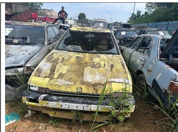
Honda Accord E-CA2