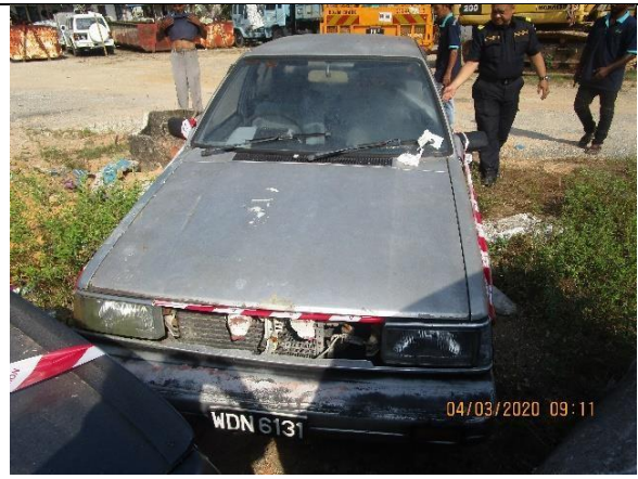
Nissan Sunny 130Y