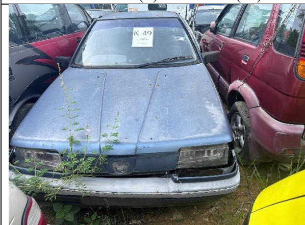
Proton Saga Iswara 1.3S