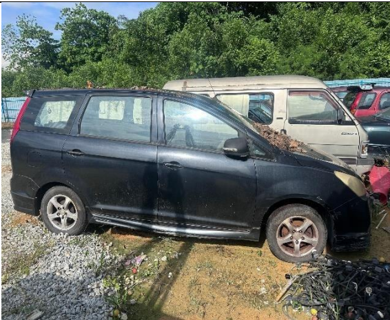
Proton Exora 1.6 Automatik