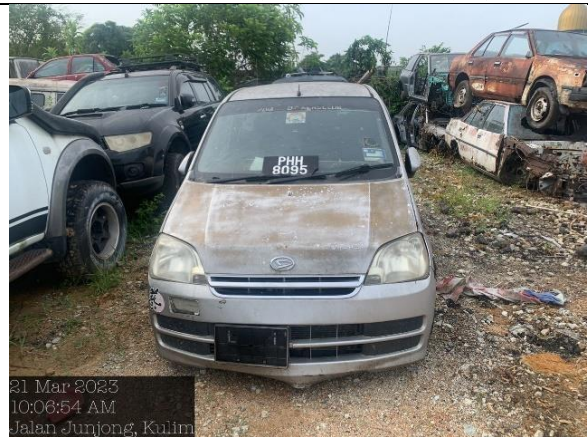
Perodua Viva 850 EX (M)