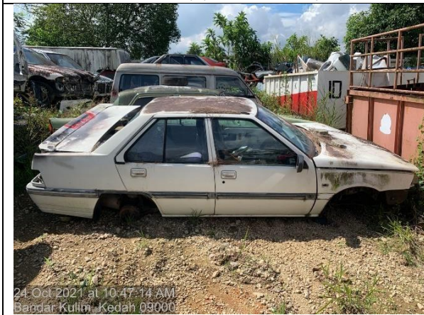
Proton Saga Iswara 1.3S PCX 2180 MPKK.JPK(S):599/24/04 (59)