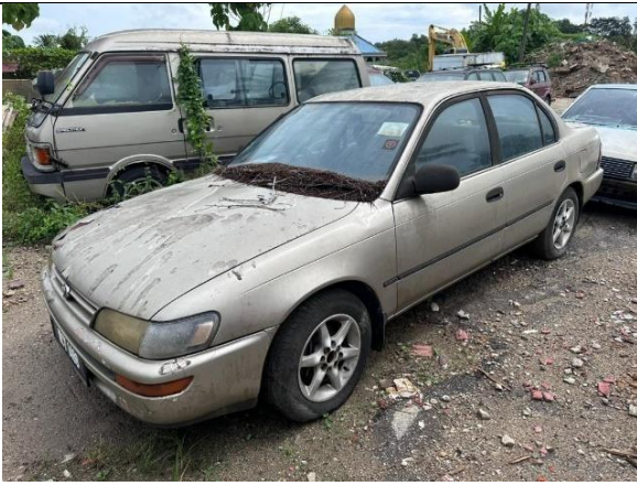
Toyota Corolla 1.6EFI