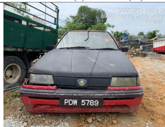
Proton Saga Iswara Aeroback 1.3S