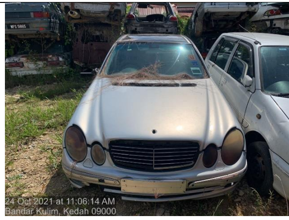
Mercedes Benz E200K-W211 AHT 8001 MPKK.JPK(S):599/24/04 (58)