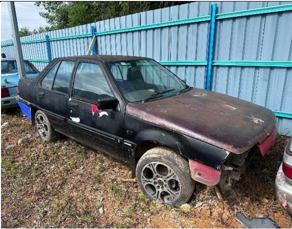
Proton Iswara 1.5S (M)