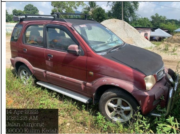
Perodua Kembara EZ