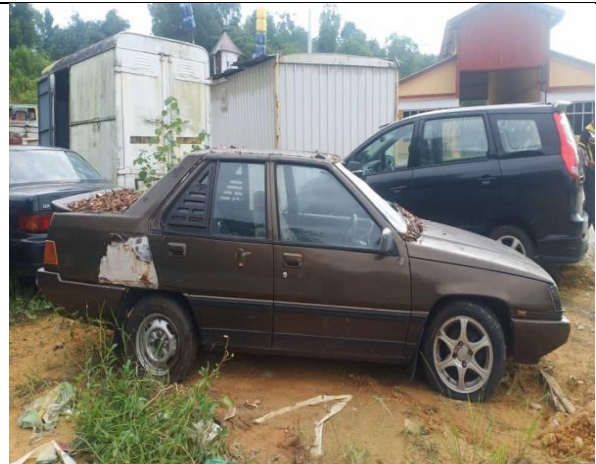
Proton Saga 1.5i