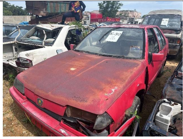
Proton Saga Iswara