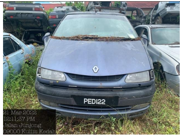
Renault Espace RXE 2.0 (A)