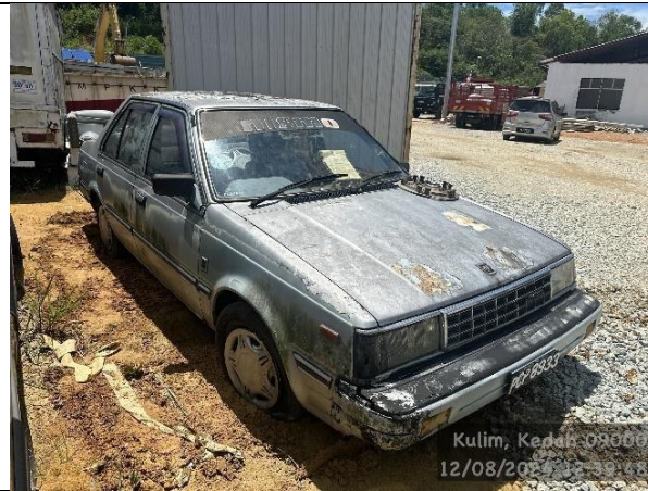
Nissan Sunny 130Y GL (M)