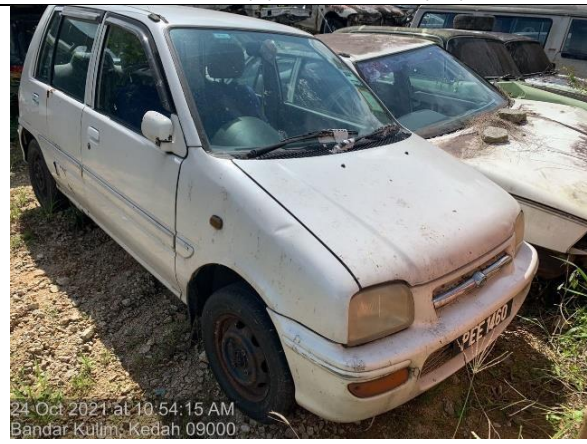
Perodua Kancil EX PEE 1460 MPKK.JPK(S):599/24/04 (60)