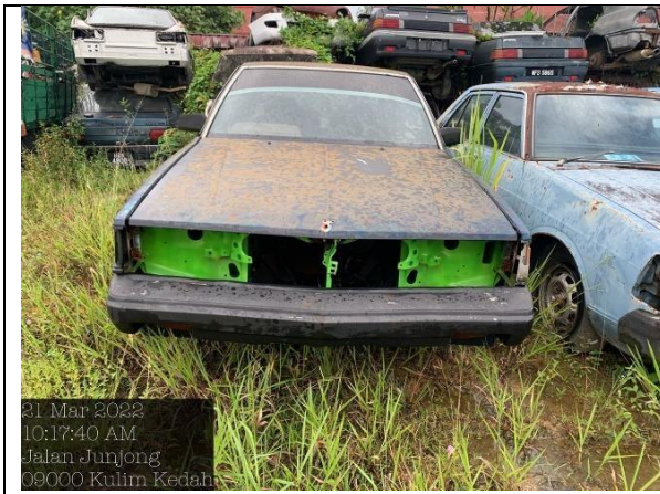
Toyota Corona 1800