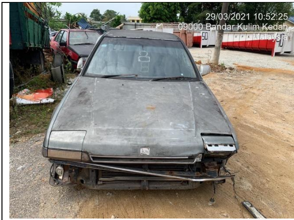
Honda Accord WCD 7980 MPKK.JPK(S):599/24/04 (57)