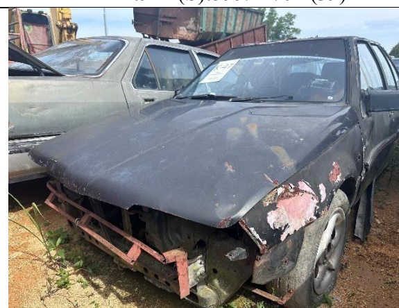
Proton Saga Iswara 1.3S