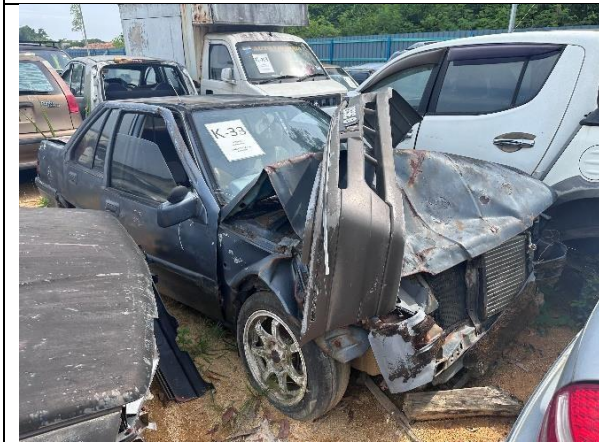
Proton Saga Iswara