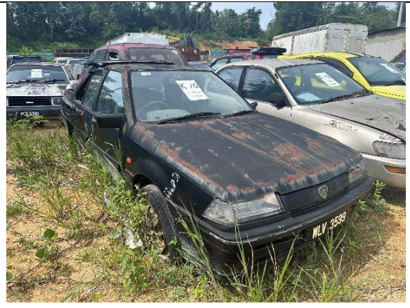
Proton Iswara 1.5S(M)