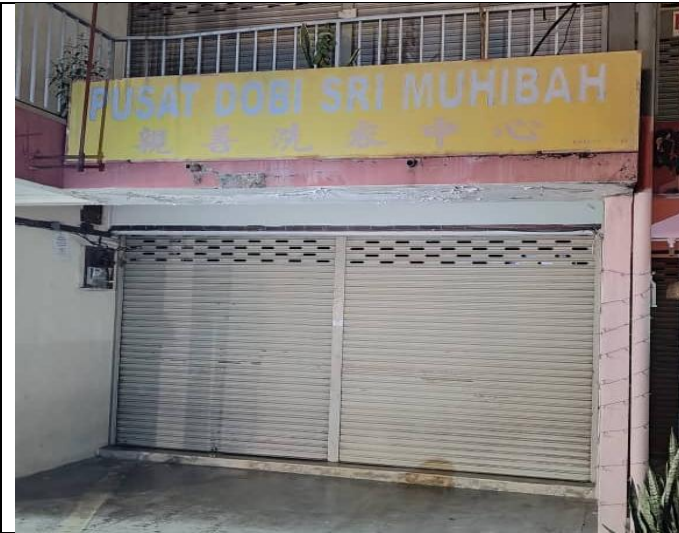
NO. 3 ARKED SERI MAKMUR (BAWAH)