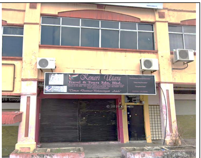
NO. 159B RUMAH KEDAI 2 TINGKAT PERNIAGAAN PUTRA