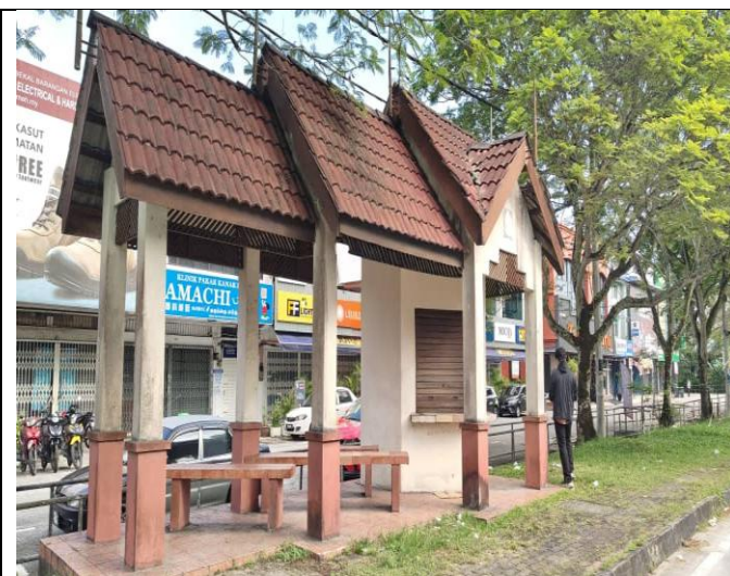
NO. 1 KIOSK TAMAN MANGGIS