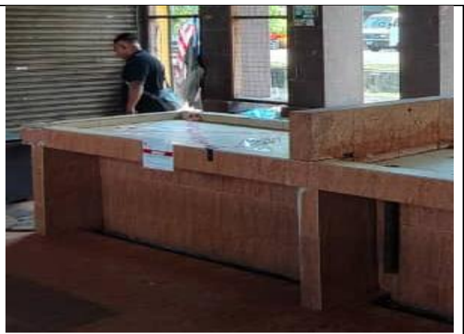
NO 21. PASAR KELANG LAMA (AYAM)