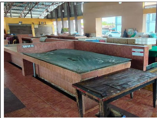
NO. 22 PASAR KELANG LAMA (SAYUR)