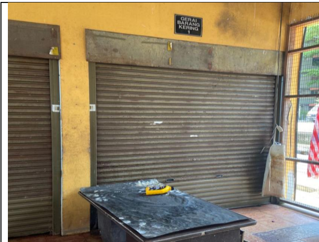
NO.1 PASAR KELANG LAMA (BARANG KERING)