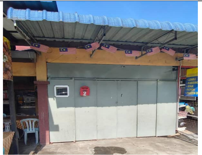
NO. 2 GERAI SERI CEMPAKA PEKAN JUNJONG