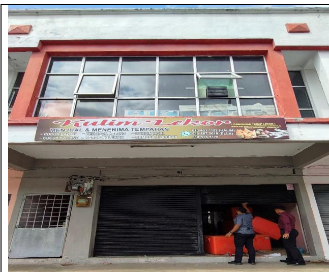
NO.112 KEDAI KOTA KENARI (BAWAH)