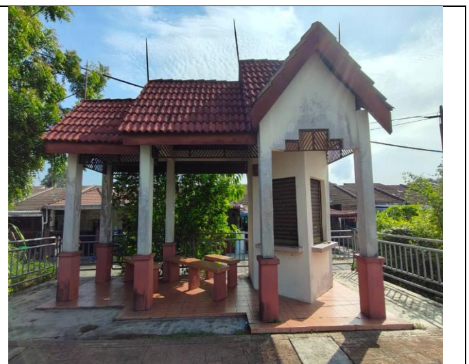
NO. 4 KIOSK PONDOK BAS TAMAN PUDINA