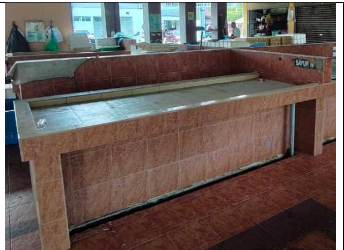
NO. 19 PASAR KELANG LAMA (SAYUR)